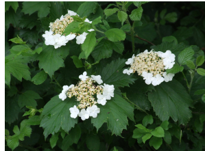
une viorne obier