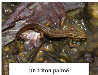
un triton palmé