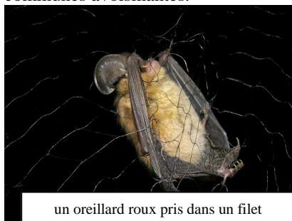
un oreillard roux pris dans un filet

Cette opération mise en place par la SFPEM (Société Française pour l'Etude et la Protection des Mammifères), permet le recensement de 12 espèces de chauves-souris sur Piré et les communes avoisinantes.