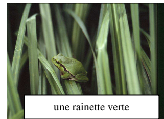
une rainette verte