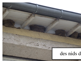
des nids d'hirondelles de fenêtre

La LPO (Ligue pour la Protection des Oiseaux) sollicite l'ECUREUIL pour effectuer un comptage des nids d'hirondelles et de martinets. 45 nids d'hirondelles de fenêtre sont dénombrés dans le cadre d'un atelier avec les enfants.