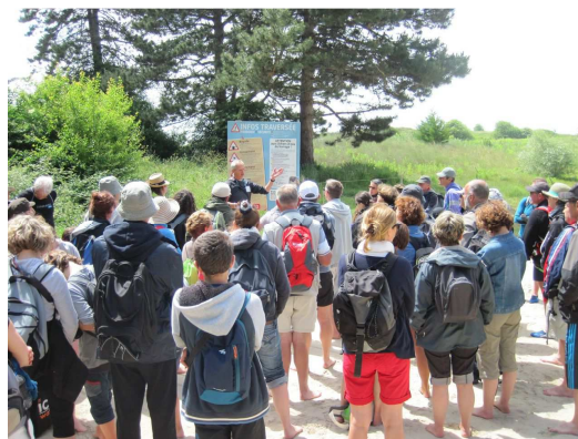
Les recommandations du guide avant la traversée

Le groupe s'est ensuite lancé les pieds nus pour affronter les 14 km aller-retour. Nous avons ainsi découvert le fonctionnement de la baie et ses dangers et pu observer quelques-uns de ses habitants : le gravelot à collier interrompu, les tadornes de Belon, les huitriers-pies, les bécasseaux. Après une pause bienvenue au pied du Mont St-Michel, nous avons fait un détour par Tombelaine où l'on a pu admirer les acrobaties des faucons pèlerins au milieu de centaines de goélands.