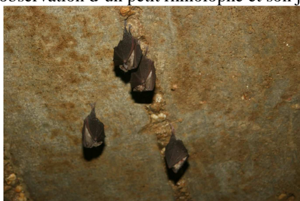
4 petits rhinolopes pendant l'hiver

Les aménagements réalisés par les membres de l'ECUREUIL pour l'accueil des chauves-souris ont favorisé la présence de ces petits mammifères volants avec notamment la présence de 3 espèces et un indice de reproduction avec l'observation d'un petit rhinolophe et son jeune.