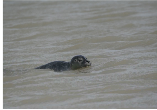
Rencontre avec un jeune phoque veau-marin