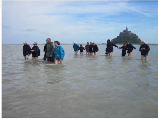
La traversée les pieds dans l'eau